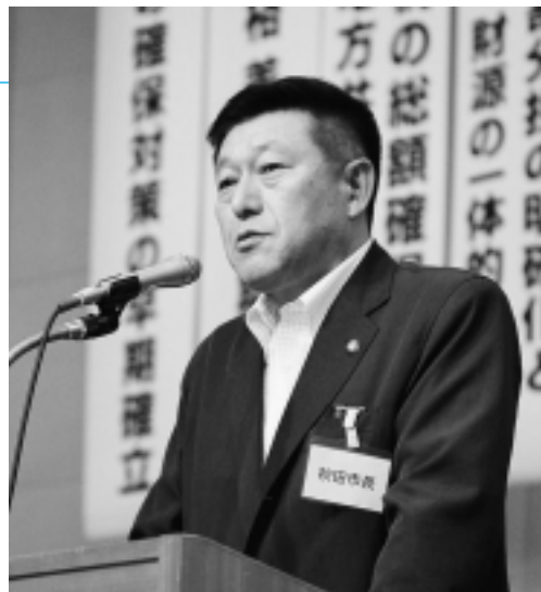
6月6日、全国市長会総会で会長就任あいさつ