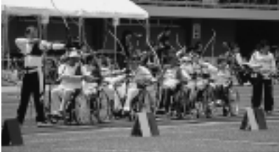
八橋陸上競技場で行われたアーチェリー

6月10日、秋田わか杉大会のリハーサル大会が行われ、選手たちのひたむきなプレーに観客から温かい拍手が送られました。選手はもちろん、ボランティアのみなさんも大活躍！