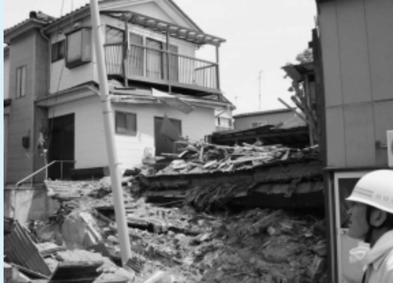
倒壊した家屋(7月19日、柏崎市)