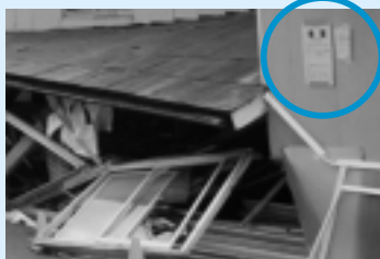
建物の危険度を表す紙を貼ります