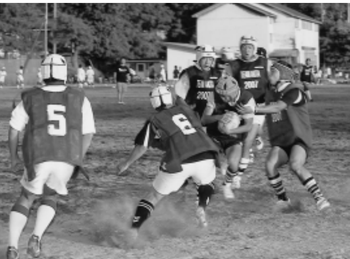
勝利に向かって突進!