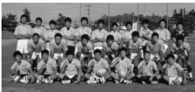
精鋭ぞろいの「オール秋田2007」チーム

国体まで、県外遠征や合宿でチーム力を強化。スクラムがちりちり、自慢のタックルで、めざすは優勝です!