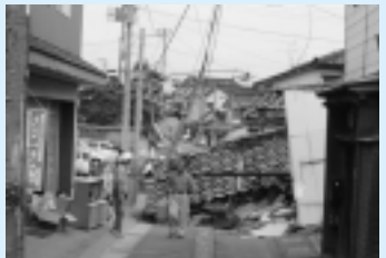
道が分断され、移動も困難