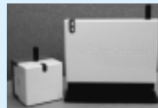
地震速報サービス用の装置...親機(右)と子機

CNA秋田ケーブルテレビでは、10月から、地震が到達する時刻と震度を音声でお知らせする「緊急地震速報サービス」を始めます。ケーブルテレビの回線に専用の装置