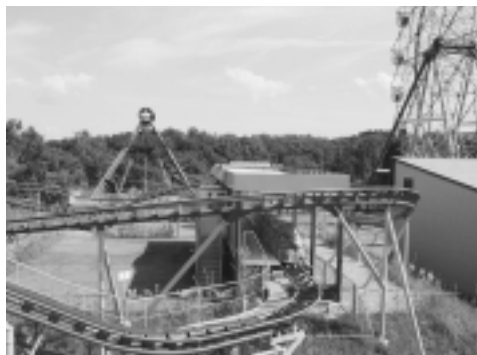
春には子どもの歓声が戻ります

今年7月から閉鎖されている大森山遊園地を、大坂市の遊園地遊具メーカーの豊永産業(株)が引き継ぎ、来春の営業再開をめざすことになりました。