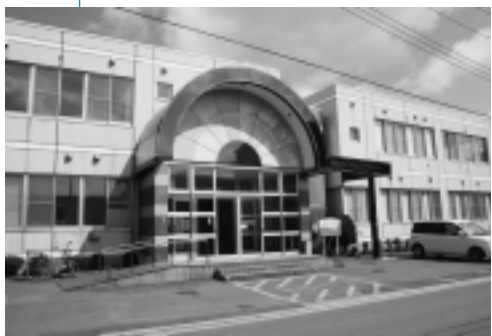
明德地区コミュニティセンター