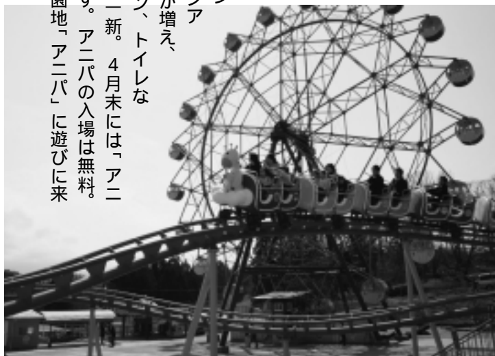
「キリンフォレストのジェットコースター」

4月1日、大森山遊園地が「アニパ」という新しい名前でのリニューアルオープンしました。動物たちの夢の楽園「アニマルパラダイス」をイメージしたアニパ。新しいアトラクション「ウサギアンバーのジャンピングスター」と「子羊シアンの森(ミラーハウス)」が増え、観覧車や遊具、レストラン、トイレなどのデザインやカラーも一新。4月末には「アニマル列車」も登場予定です。アニパの入場は無料。生まれ変わった大森山遊園地「アニパ」に遊びに来てね