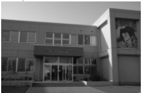
港北地区コミュニティセンター