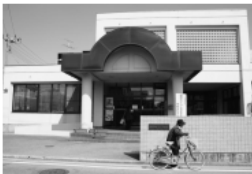
泉地区コミュニティセンター

頻繁に利用するサークルなどは、4月から施設の予約を電話でもできるようにしました。また、館内を禁煙にしました。今後も地域のかたに気持ちよく利用してもらえるように、利用方法などを考えていきます。