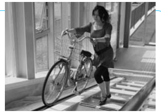
コンベヤーを利用するときは 前ブレーキをかけて

秋田駅東西歩道橋(Weロード)は、8月2日(土)午前10時から自転車と一緒に通行できるようになります。自転車は東西の昇降口に設置した自転車搬送コンベヤー(昇り用)で運ぶことができます。なお、通行するときは、必ず自転車を降りてください。また、エレベーター、トピコ、ホテルメトロポリタン方面への自転車の乗り入れはできませんのでご注意ください。