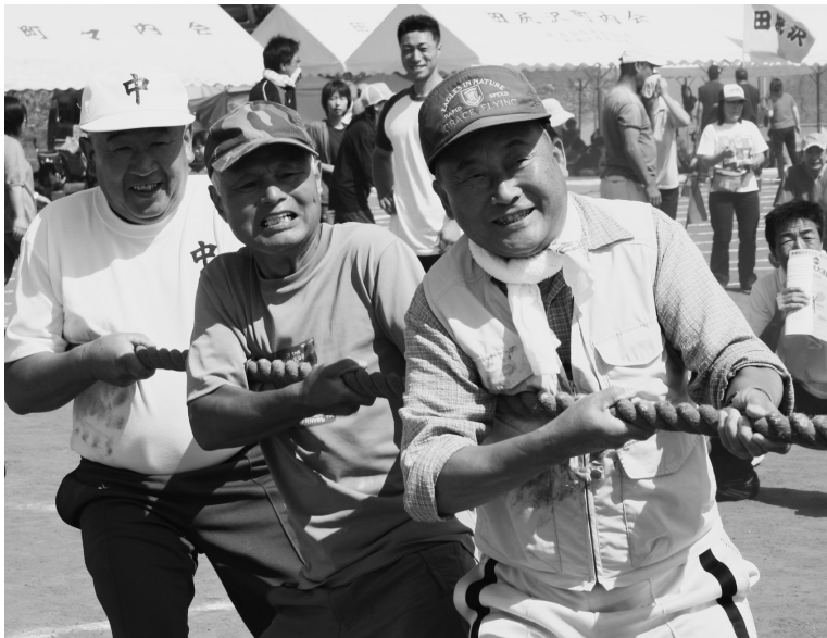
新屋地区のスポレクで