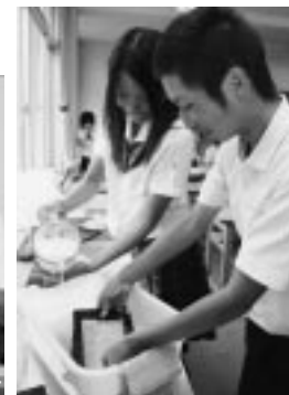
和紙も 1枚1 枚丁寧 に作り ます