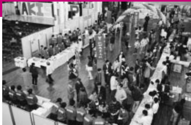
昨年 のアキ ショップ

エコ活動 エコバッグの推進、秋商エコキャップ運動(ペットボトルのキャップ800個をワクチン1本に換え、発展途上国へ送ります。当日も集めますのでみなさんご協力を！)