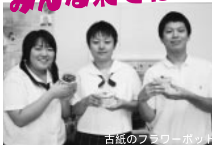
古紙の フラワー ポット