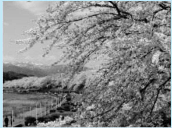
桧木内川堤のソメイヨシノ

まつり期間中は、ライトアップや出店、郷土芸能(飾山囃子)の披露など、さまざまなイベントが行われます。