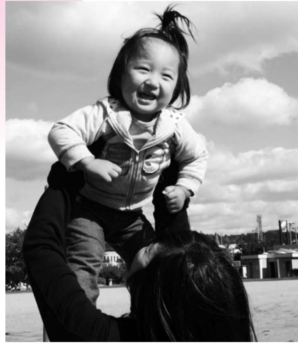
愛情いっぱい育てますように