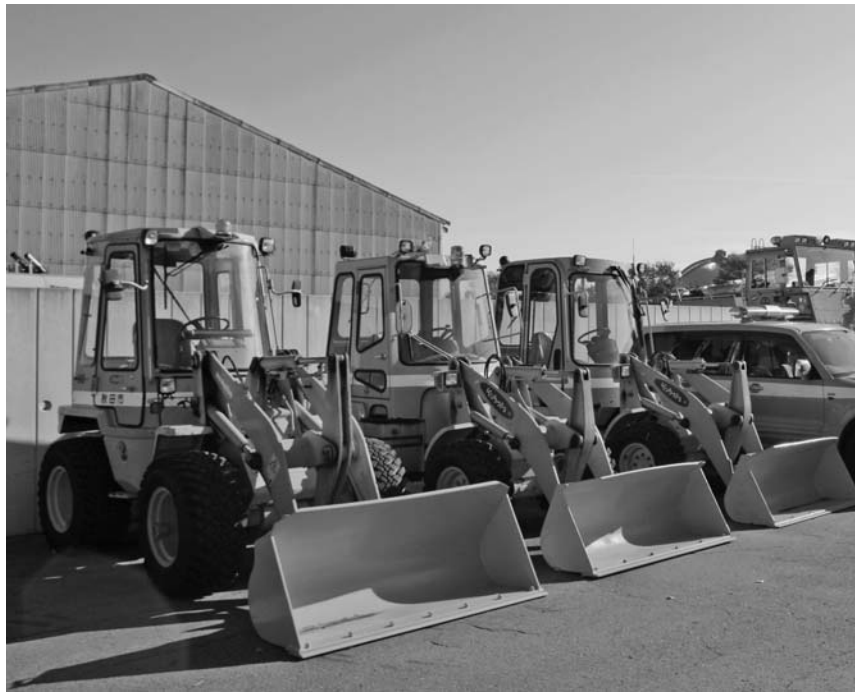
除雪ドーザ、パトロール車、排雪ロータリなど、準備は万端