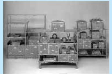
花菱月丸扇紋三棚

6月18日(土) 午後2時～3時30分 千秋美術館3階講堂 参加無料 先着50人