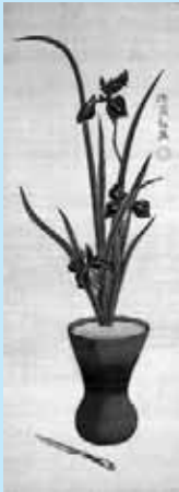
燕子花にナイフ 図(佐竹曙山)

ギャラリートーク…6月11日(土)・26日(日)、午後2時～。直接、千秋美術館へどうぞ(観覧料が必要です)。