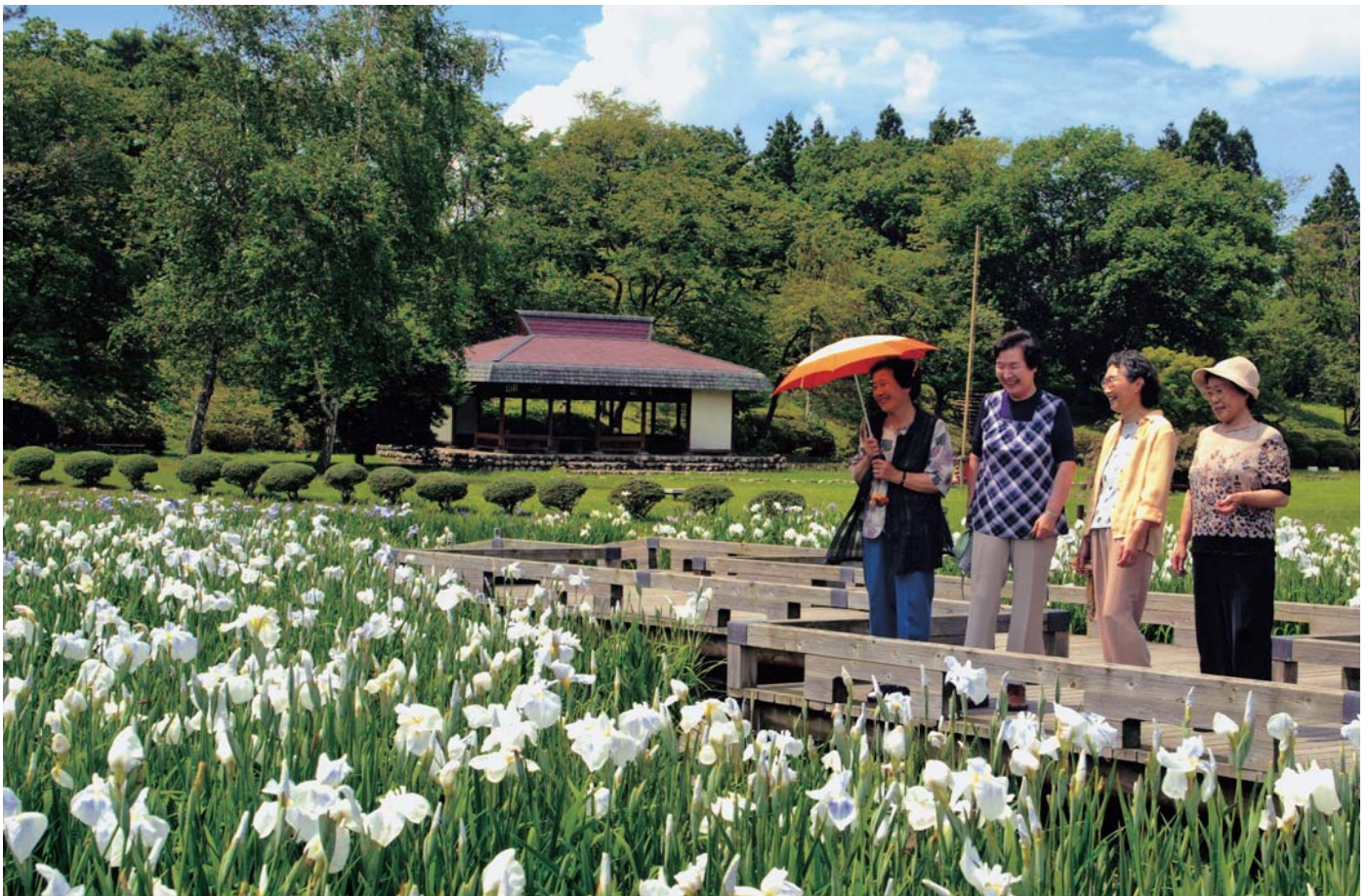
咲き誇るハナショウブに暑さを忘れます(7月13日、金足の小泉瀧公園)