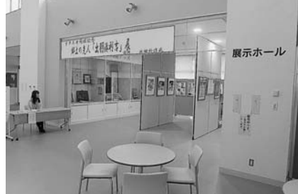
正面玄関の左側です

北部市民サービスセンター「キタスカ」1階にある展示ホールは、地域活動や生涯学習の発表の場などにご利用いただけます。広さは約80㎡。非営利目的のものは使用料は無料です。お気軽にご利用ください。