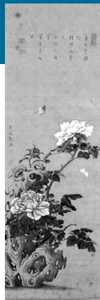
岩に牡丹図(佐竹曙山)

6月1日(金)▶7月4日(水) 午前10時～午後6時 一般300円、高・大学生200円 中学生以下無料