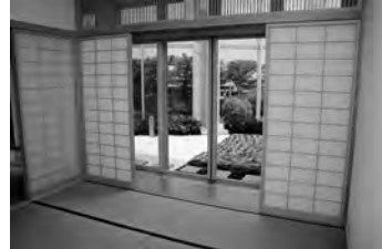
お堀が一望できる4階の和室