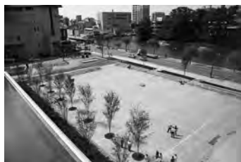
屋外イベントに。にぎわい広場