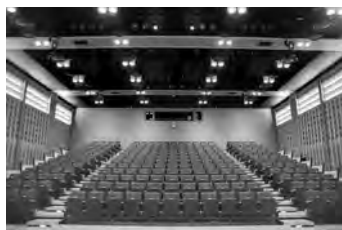
300人収容の3階多目的ホール

7月21日(土)、エリアなかいち(中 通)の「秋田市にぎわい交流館AU」 がいよいよオープンします。 館内には展示ホールや研修室、 音楽練習室、アート工房などの施 設があります。ぜひ、さまざまな 活動にご利用ください。詳しくは、 秋田市にぎわい交流館へお問い合わせ ください。☎(853)1133