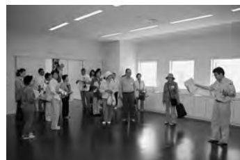
6月29日に行われた施設見学会