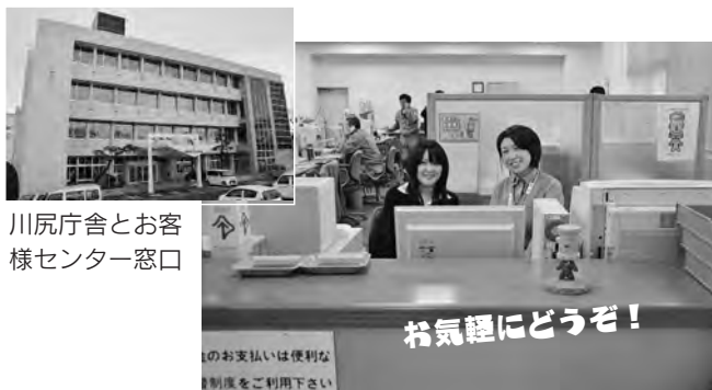
川尻庁舎とお客様センター窓口