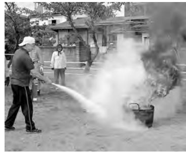
火事ふれをしてすばやく消火!