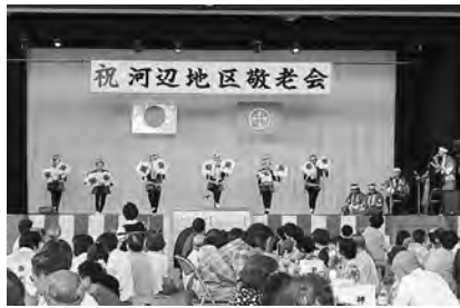
花笠を手にしなやかな踊りを披露