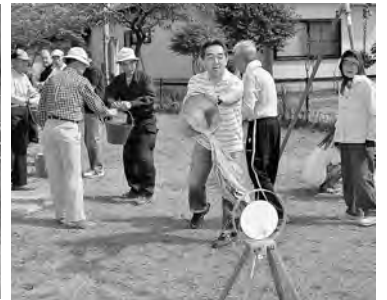
バケツリレーは連携が大事!

9月21日、秋田建築労働組合青年部のみなさんが、地域貢献の一環として、東通仲町の拠点第一街区公園のベンチや東屋の補修などを行いました。同青年部では、毎年このようなボランティア活動を行っており、今年が13回目になります。ありがとうございました。