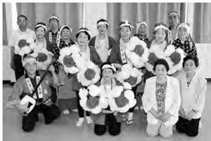
みんなの力で復活させました！