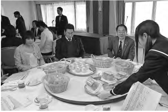
17歳の6次産業化プロジェクト商品アイデア発表会で