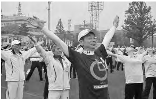
朝の日課、ラジオ体操 (5月に行われたチャレンジデーで)