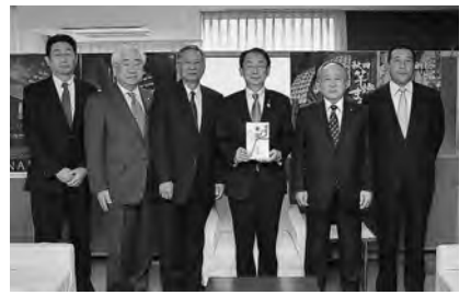
10月14日、(一社)秋田市建設業協会のみなさんから目録をいただきました