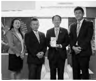
10月15日、秋環連のみなさんから目録をいただきました