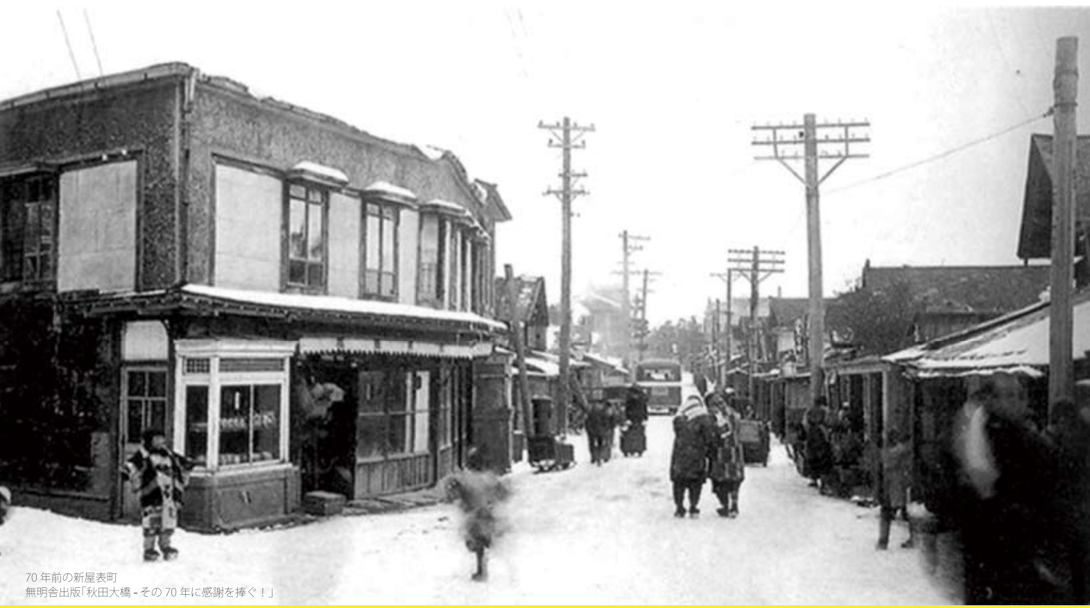
70 年前の新屋表町 無明舎出版「秋田大橋 - その 70 年に感謝を捧ぐ！」